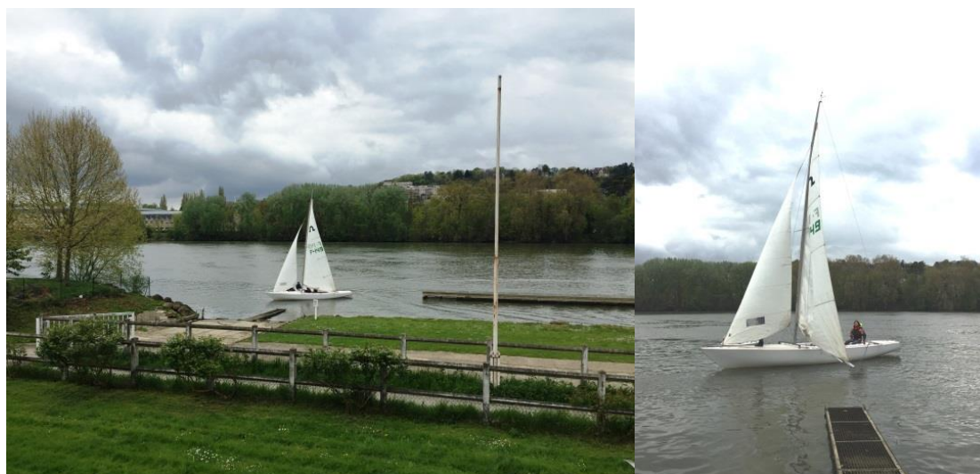
Un petit moment de solitude...