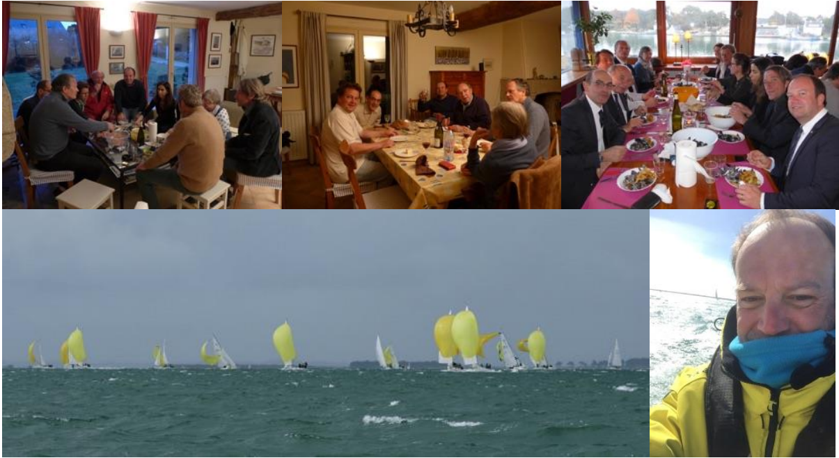
Vivement l'année prochaine !! »