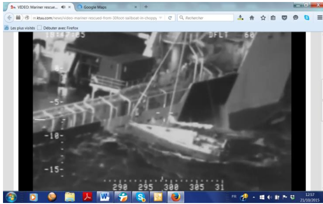
Extrait de la vidéo des US Coast Guards