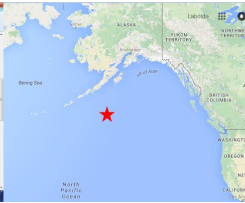
Position approximative du bateau