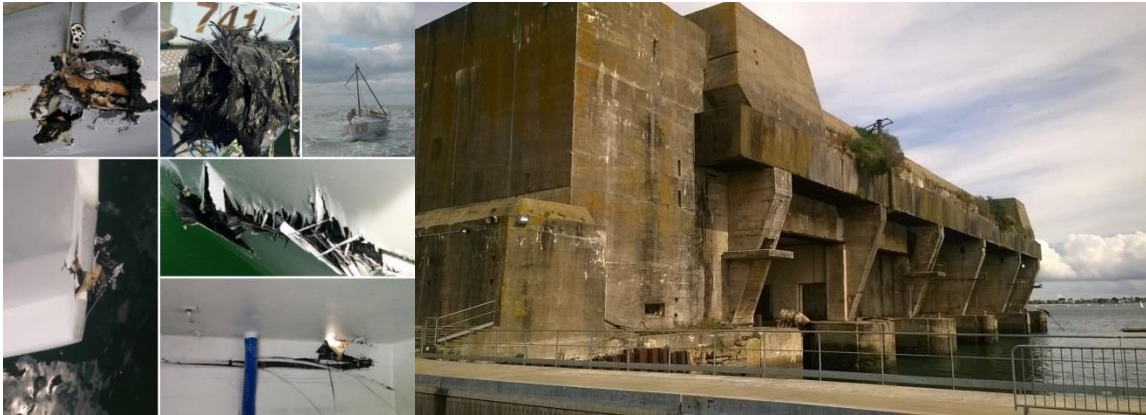
Gauche : les photos des ennuis qu'a connu FRA 630 depuis 2 ans

Vous pouvez aussi lui adresser un mail d'encouragements à contact.cvp@laposte.net , nous transmettrons.