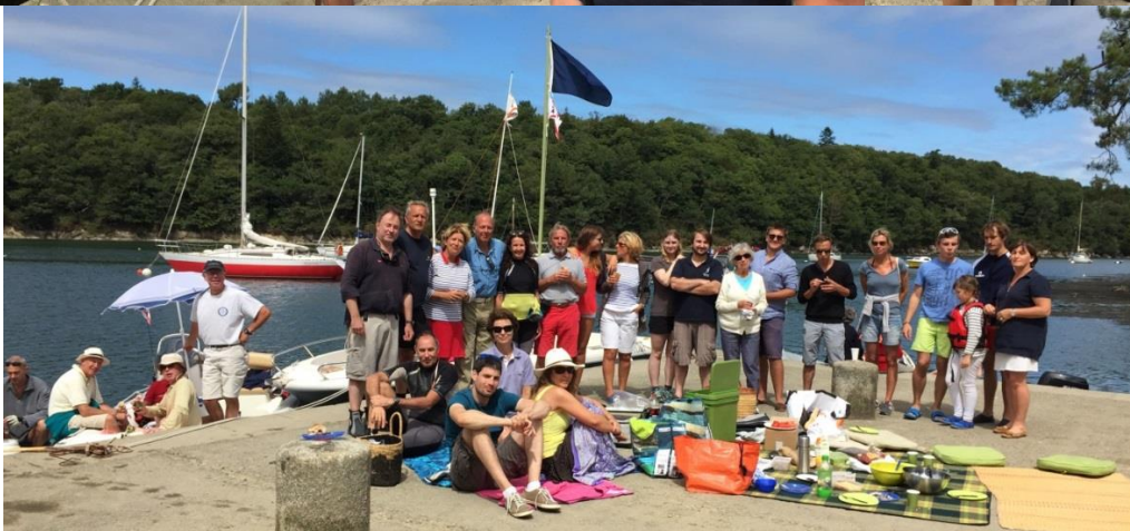
L'équipe du CVP, les familles et les alliés en plein pique-nique. Chacun reconnaîtra les siens...