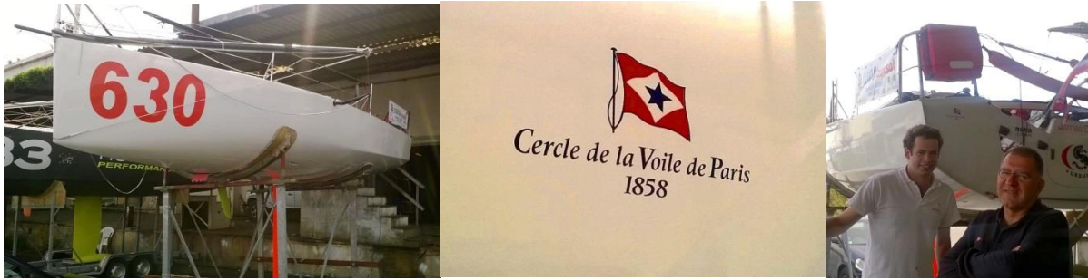
FRA 630 arbore fièrement les couleurs du CVP

Visite de FRA 630 en compagnie de Nicolas avant cette dernière ligne droite.