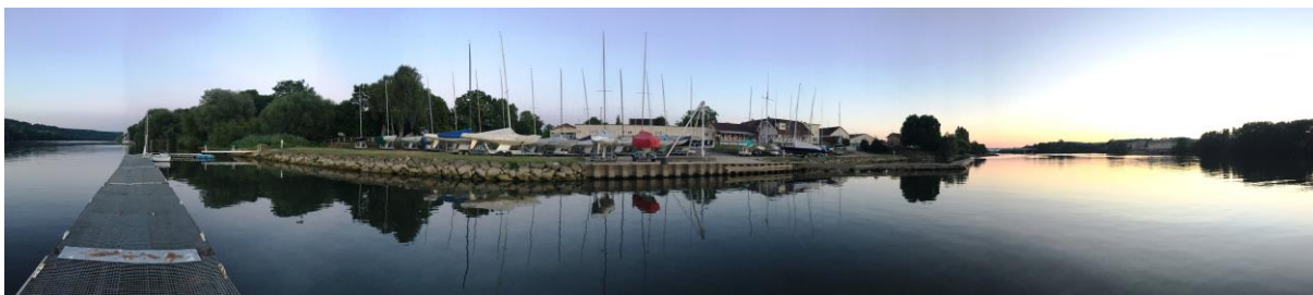
Le 14 juillet 2015, à 21h30, le CVP vu du ponton flottant