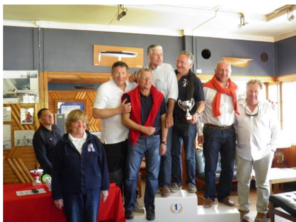
Le podium des M7.50