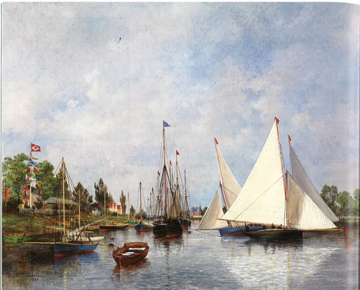
Argenteuil, 1883. Gaston Bruelle, Huile sur toile, 60 x 81 cm.

depuis 1878, le CVP est une société de navigation de plaisance fluviale et maritime à voiles et à vapeur, créée en 1858. Il a son siège à Paris, rue Saint-Lazare, où, l'hiver, un cycle de conférences maritimes rassemble sociétaires et amateurs.