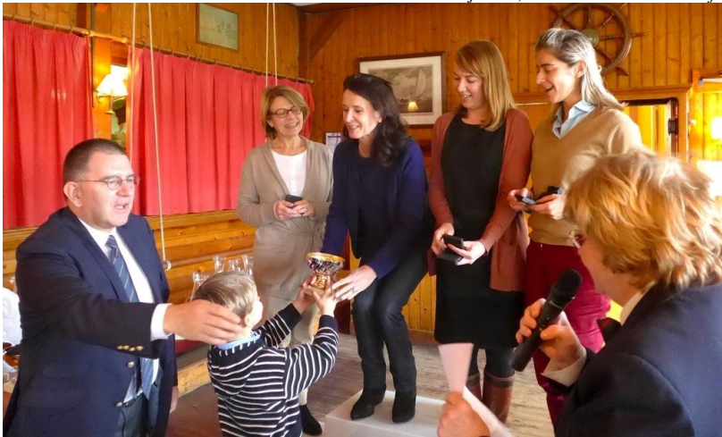
Les meilleures féminines