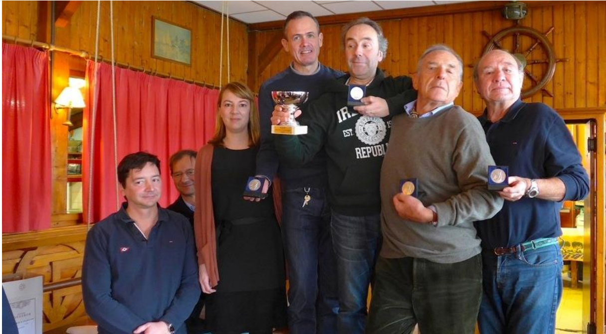
Les meilleurs équipages 2014 du CVP