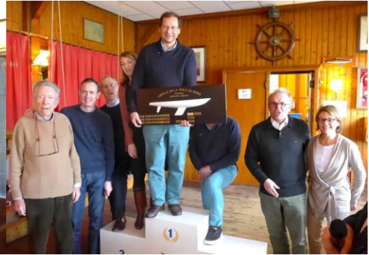
Trophée Jacques Lebrun