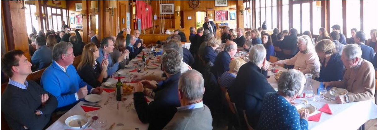
Pendant le déjeuner, des convives très attentifs