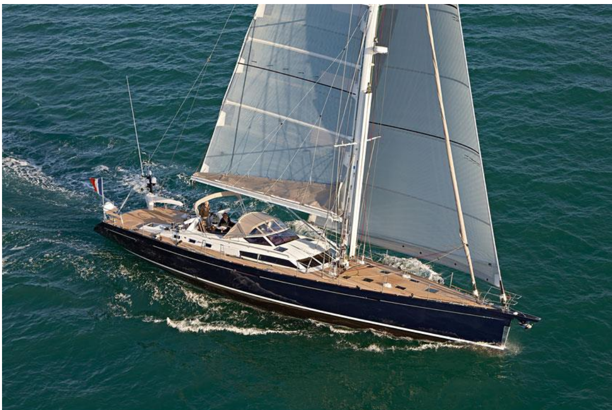
Berret-Racoupeau 74' Annka 1 - 10/2009 - Mention obligatoire / Mandatory credit: Photo Nicolas Claris

Christian Péguet compte profiter de sa présence plus fréquente en France pour nous retrouver à l'occasion d'un déjeuner d'hiver ou d'un week-end de printemps. Nous pourrons ainsi faire plus ample connaissance et l'écouter nos raconter ses aventures maritimes.