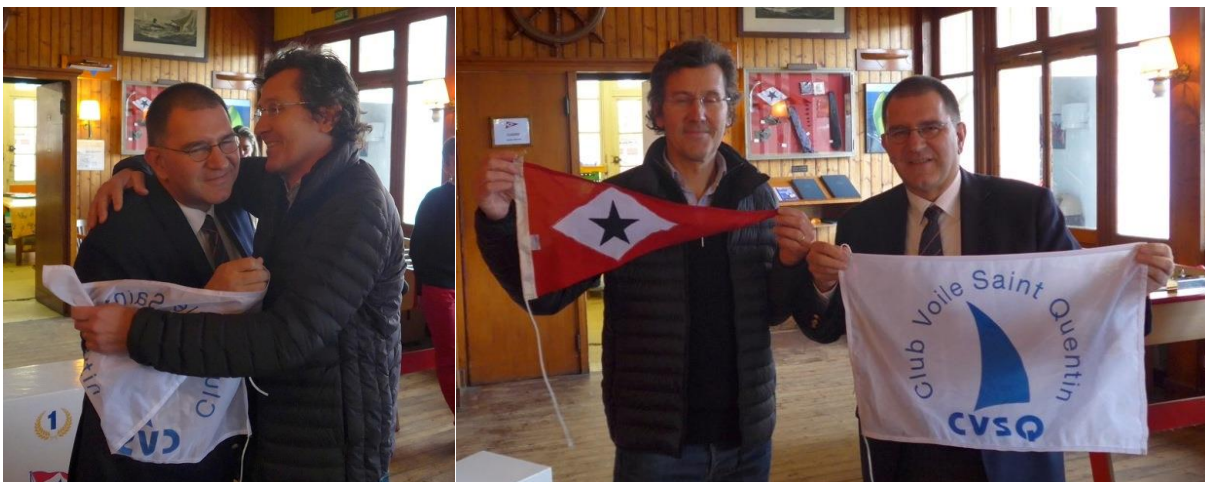
CVSQ et CVP, au-delà du protocole, l'amitié

Bref, un dimanche comme on les aime au CVP.